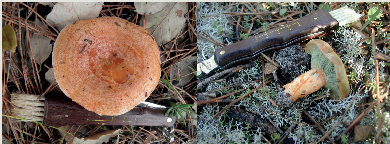
Figura 2 – A espécie Lactarius deliciosus é conhecida por lactário-delicioso, sanchas, pinheiras, cenoura ou cenourinha, verdete, etc. Tem um chapéu cor de laranja com zonas avermelhadas concêntricas e margem enrolada (à esquerda). O pé é curto e oco, com manchas circulares mais claras (à direita)