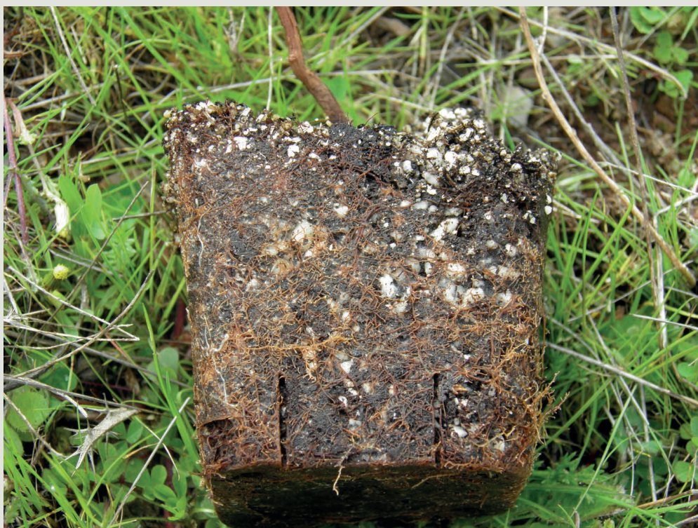
Figura 4 - Medronheiros inoculados com lactário-delicioso em condições de viveiro. No momento da plantação era possível observar a extensa colonização das raízes pelo fungo

Para aperfeiçoar os métodos de inoculação, foram realizados vários ensaios de micorrização utilizando diferentes clones de medronheiro micropropagados, em condições de laboratório e em viveiro. Foram usados substratos contendo mistura de turfa, vermiculi-