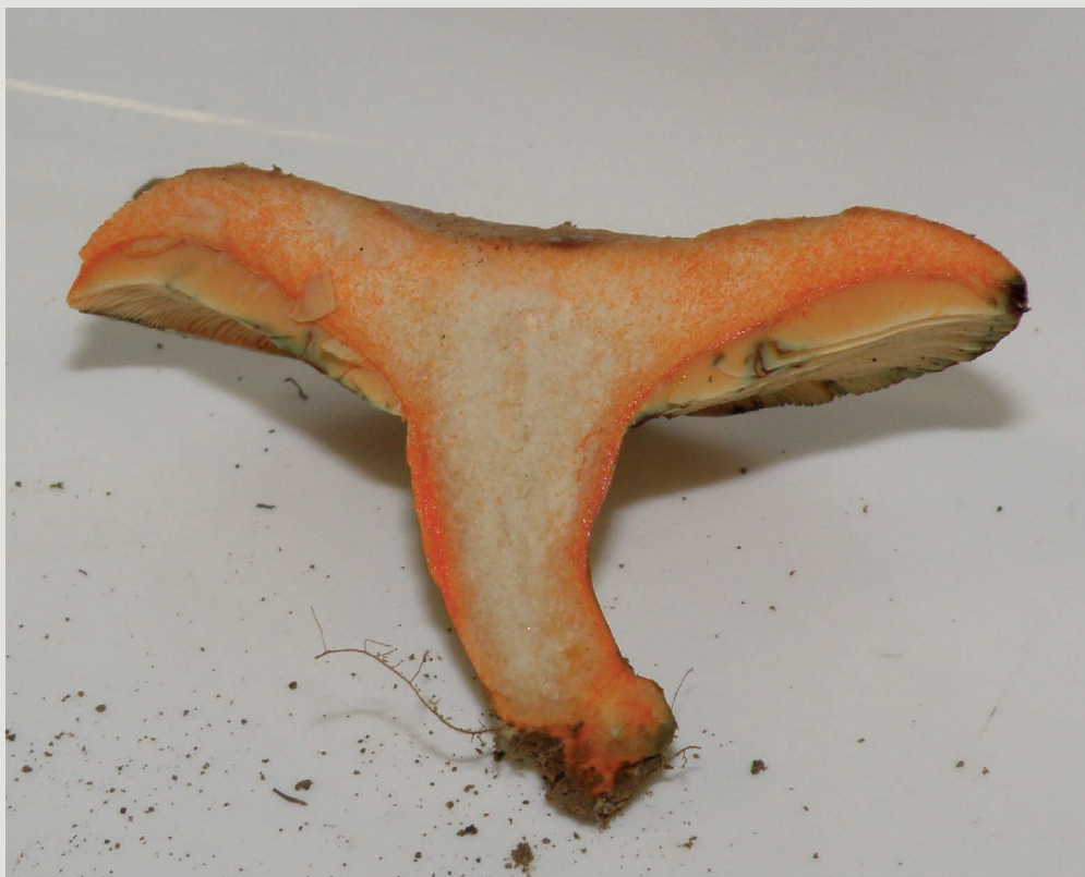
Figura 3 - O lactário-delicioso deita leite alaranjado ao efetuarmos um corte e o chapéu e as lâminas mancham rapidamente de verde com o manuseamento

Numa primeira fase, foi confirmada a compatibilidade entre o medronheiro e a espécie de lactário-delicioso em condições de laboratório. O tipo de inóculo (em meios