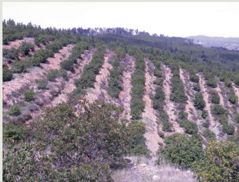
Figura 5 – Aspeto de pomar de medronheiros micorrizados instalado em Oleiros

Os medronheiros micorrizados podem ser plantados em qualquer altura do ano, desde que exista disponibilidade de água no solo. Pode ser necessária uma rega suplementar durante os meses de verão. No entanto, deve ter em atenção que o excesso de água no solo dificulta o desenvolvimento do fungo. Em termos gerais, as operações de instalação e manutenção são idênticas às recomendadas para a instalação de um pomar de medronheiros não micorrizados. Para infor-