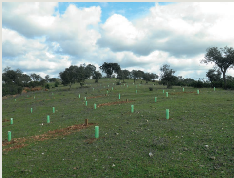
Figura 6 – Aspeto de plantação mista de medronheiros micorrizados e alfarrobeiras, em Mértola