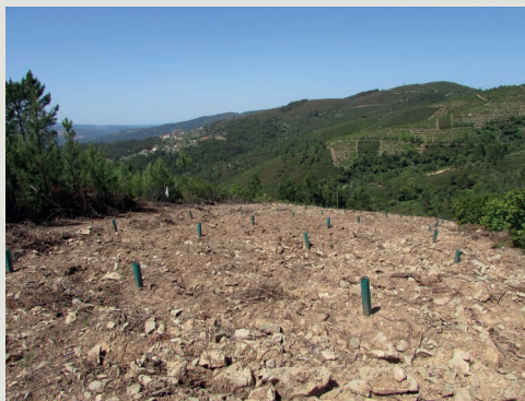
Figura 7 – Ensaio instalado em 2017, na Pampilhosa da Serra, com medronheiros micorrizados

mações mais detalhadas poderá consultar o “Manual de Boas Práticas para a Cultura do Medronheiro” (Gomes et al. , 2017).